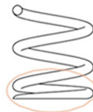
Lihvitud, tasandatud otsad