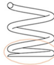
Nedlagda och slipade